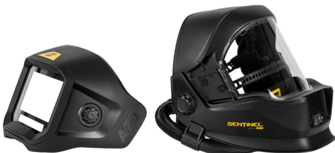
Sentinel A70 Air Pro kivehető ADF