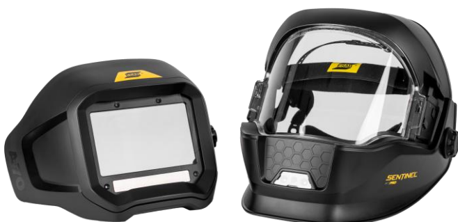
Sentinel A70 Pro ADF, abnehmbar

Weitere Informationen finden Sie unter esab.com .