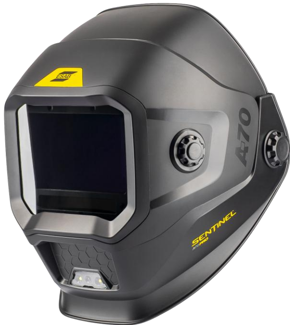
Sentinel A70 Pro