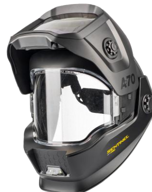
Sentinel A70 Pro