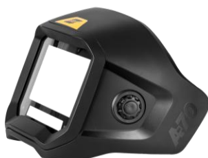
Sentinel A70 Air Pro ADF, abnehmbar

Weitere Informationen finden Sie unter esab.com .