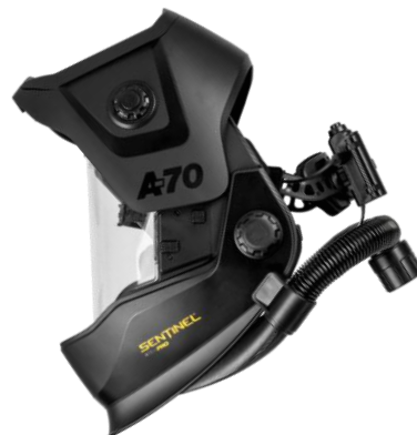
Sentinel A70 Air Pro