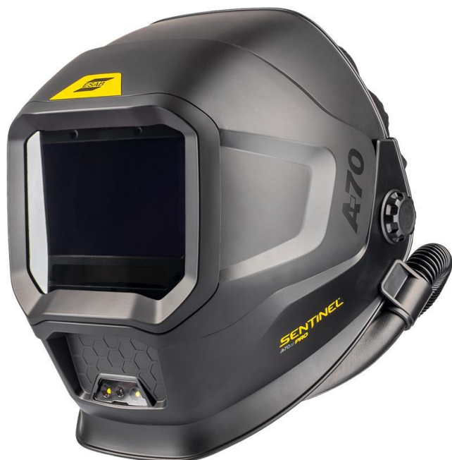
Sentinel A70 Air Pro